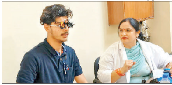
रादौर। कॉलेज में छात्र की आंखों की जांच करती डॉक्टर।

जेएमआईटीआई इंजीनियरिंग कॉलेज में निःशुल्क नेत्र जांच शिविर का आयोजन किया गया। शिविर का मुख्य उद्देश्य विद्यार्थियों एवं स्टाफ के नेत्र स्वास्थ्य की जांच करना तथा उन्हें आंखों से संबंधित समस्याओं के प्रति जागरूक करना था। शिविर के दौरान विशेषज्ञ चिकित्सकों की टीम ने उपस्थित विद्यार्थियों की आंखों की विस्तृत जांच की। जिन विद्यार्थियों को दृष्टि संबंधी समस्या पाई गई, उन्हें उचित उपचार एवं चश्मे के लिए सलाह दी