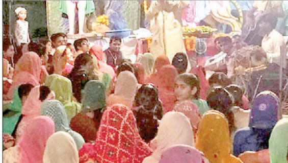
प्राचीन श्री देवी मंदिर में भजन कीर्तन कर मां का गुणगान करते श्रद्धालु।

चैत्र नवरात्र के छठे नवरात्र पर मंगलवार को श्रद्धालुओं ने मां के मंदिरों में पहुंचकर मां के छठे स्वरूप मां कात्यायनी की पूजा अर्चना की। इस दौरान भक्तों ने मां को नारियल और चुनरी चढ़ाकर पूजा अर्चना की और अपने परिवार की सुख शांति