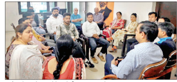
रादौर। बैठक में भाग लेते स्वदेशी जागरण मंच के सदस्य।

स्वदेशी जागरण मंच के सदस्यों द्वारा आयोजित की गई बैठक