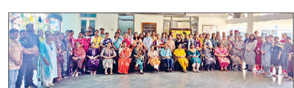
अंबाला। कार्यक्रम के दौरान मौजूद शिक्षक।