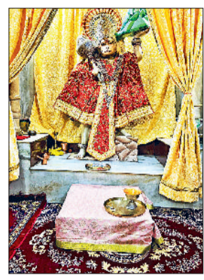
श्री हनुमान की तस्वीर।