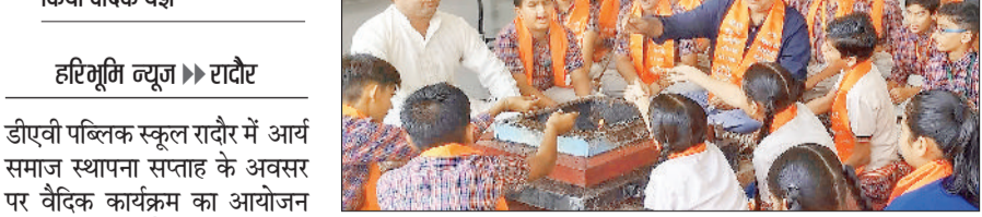
रादौर। आहुतियां अर्पित करते हुए बच्चे व स्टाफ सदस्य।