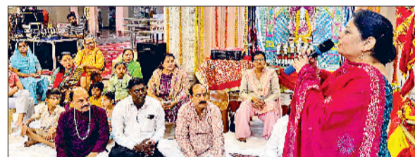
अंबाला। दाती दा दरबार कार्यक्रम में प्रस्तुति देती कलाकार।